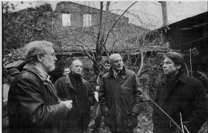
Alain Rousset et une délégation ont visité le futur écoquartier des Chartrons