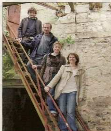
Le collectif citoyen H'Nord, fondé en 2006