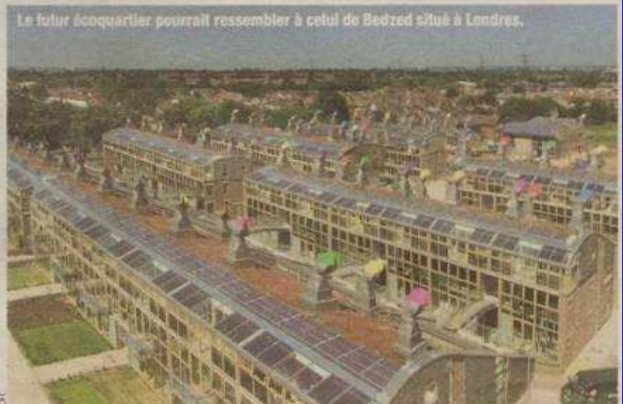
Le futur écoquartier pourrait ressembler à celui de Bedzed situé à Londres.

Désormais, le programme est fixé : quatre-vingts logements sont prévus, allant de la chambre d'étudiant à des appar-