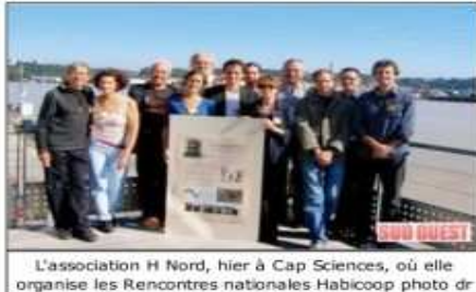
L'association H Nord, hier à Cap Sciences, où elle organise les Rencontres nationales Habicoop

Venus de Suisse, de Belgique ou encore d'Auvergne, les représentants d'une trentaine de coopératives d'habitants ont rendez-vous ce week-end à Cap Sciences pour évoquer les vertus et les aléas de l'écohabitat (1).