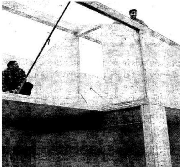
L'éco-habitat (ici à Arcachon) sera traité au salon Viv'expo

L'Ademe n'est cependant pas toujours sollicitée. C'est le cas avec